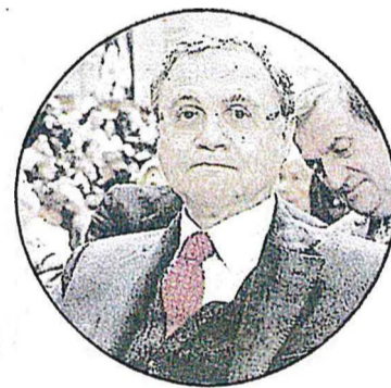
Ignazio Visco Governatore dal 2011

Economista, allievo di Federico Caffè, Ignazio Visco è stato Chief Economist e Direttore dell'Economics Department dell'Ocse. Dal 2007 al 2011 è stato vicedirettore della Banca d'Italia sotto Fabrizio Saccomanni e nel 2011 ha sostituito Mario Draghi come governatore, oggi al secondo mandato (dal 2005 il ruolo non è più a vita ma dura sei anni)